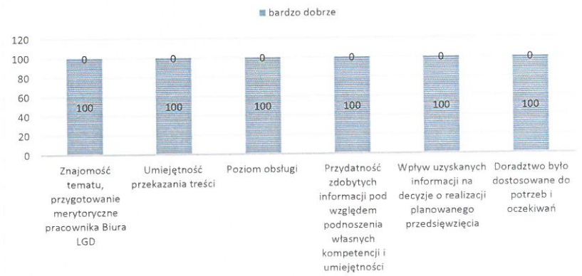
Wykres 1. Ocena doradztwa świadczonego przez pracowników Biura LGD.

Z przeprowadzonej analizy ankiet wypełnianych przez osoby korzystające z doradztwa świadczonego w biurze LGD w ogólnej ocenie wynika, że, doradztwo świadczone jest w stopniu bardzo dobrym.