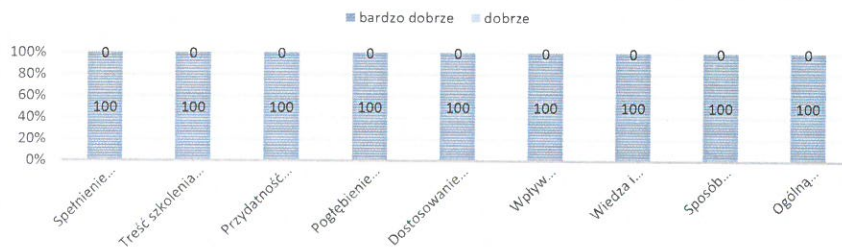
Wykres 3. Ocena działań szkoleniowych prowadzonych przez pracowników Biura LGD.

W roku 2019 do biura LGD wpłynęło 13 ankiet monitorujących działania szkoleniowe. W stosunku do obszaru częściej ze szkolenia korzystali mieszkańcy wsi (62%) niż miasta (38%). Osoby w wieku powyżej 30 lat częściej korzystały ze szkolenia (46%) niż osoby od 18 do 30 roku życia (54%). Z doradztwa korzystały kobiety 46%, mężczyźni – 54%